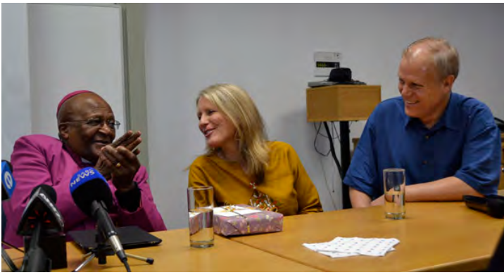
El arzobispo Desmond Tutu aprobó oficialmente GERI y su metodología en 2013.